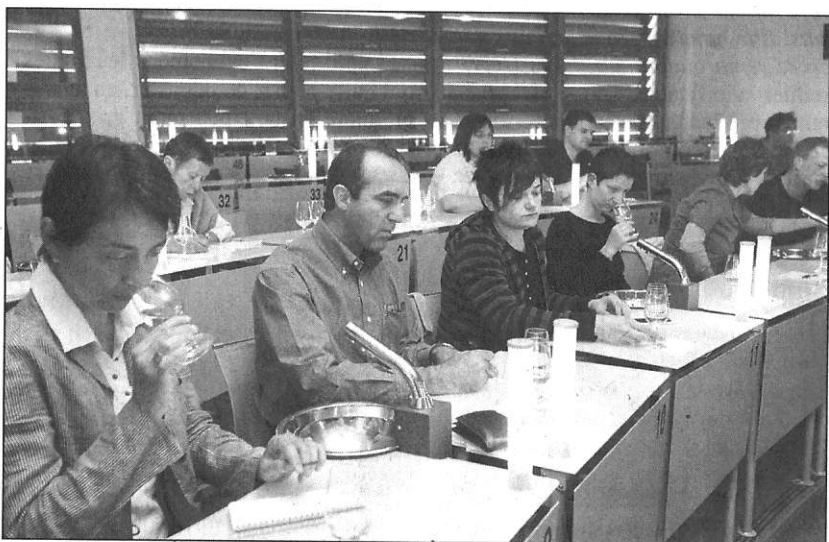
Pour la dernière dégustation avant l'été, les œnophiles ont découvert la grandeur des 2006.

Téléphone : 06 99 58 78 36 ; e-mail : thierrymeyer@oenoalsace.com.